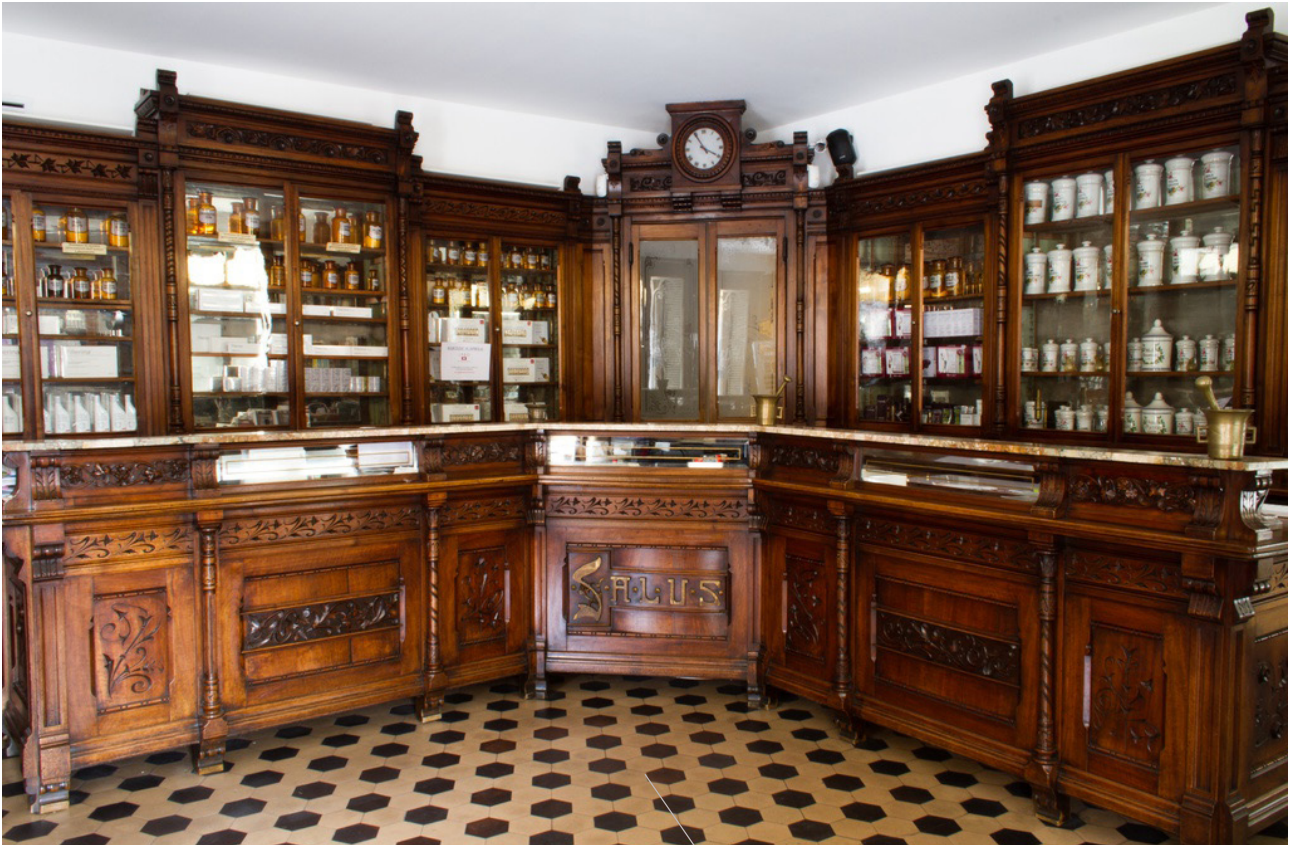
Il Museo della Farmacia Colutta